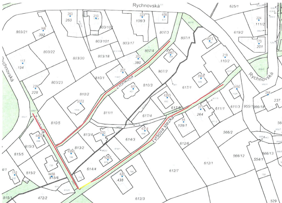
Situace z roku 2026 – doplnění p.p.č. 617/6, 807/4, 815/4